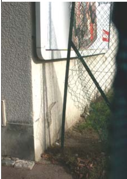
Ils sont passés par là chez Esso